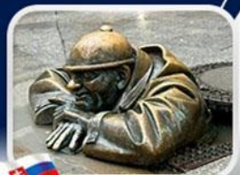
ประติมากรรม Cumil

มาเรียนพลาซซ์•บ้านเกิดโมซาร์ท•พระราชวังฮอฟบวร์ก•ซาลส์บวร์ก•บ้านเกิดโมซาร์ท•เกรโกเดร์สตรีก•ทะเลสาบคอนิกซ์•หมู่บ้านอัลลส์ตัทท์•อนุสาวรีย์มาเรียเทเรซา