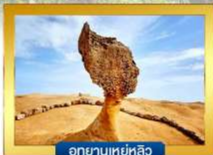
อุทยานเหย่หลิว