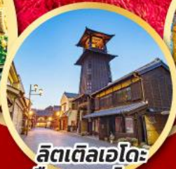
ลิตเติลเอโดะ เมืองควาโกเอะ