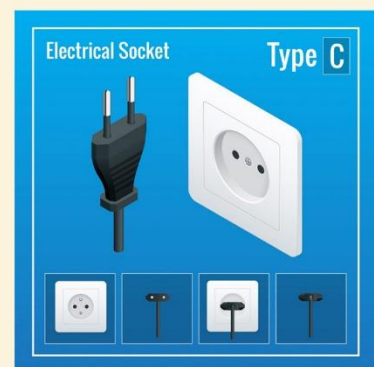
ปลั๊กไฟที่ใช้ที่อียิปต์