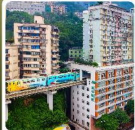
รถไฟกะลุดัก