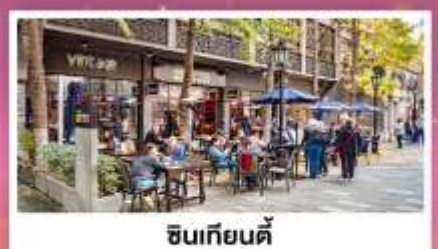
ชิวเกียนตี้