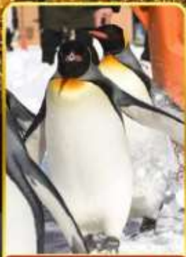
มิทซ์มารีนพาร์ค