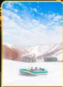
กิจกรรมโนว์ราฟติง