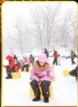
ตกปลาน้ำแข็ง