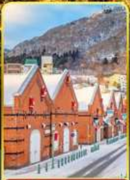
โกดังอิฐแดง