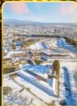
หอดาวห้าแฉก