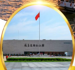
พิพิธภัณฑ์สงคราม เกาหลีตานตง