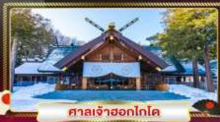
ศาลเจ้าซอกโกโด