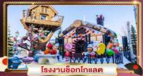
โรงงานซ็อกโกแลต