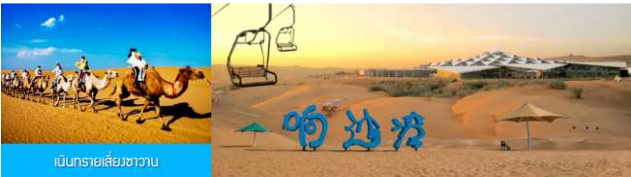
เนินทรายเสียดงชานาน

เที่ยง รับประทานอาหารกลางวัน ณ ภัตตาคาร (11)