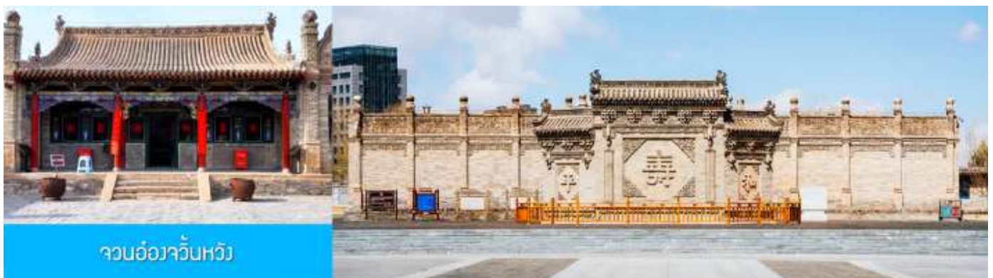
จวนอ๋องจวิ้นหวัง

จากนั้นนำท่าน เที่ยวชม จวนอ๋องจวิ้นหวัง 郡王府 จวนแห่งนี้เริ่มสร้างขึ้นในปี ค.ศ. 1902 สร้างเสร็จในปีค.ศ. 1936 เป็นที่พำนักของ อ๋องอีฉิจวิ้นหวัง 伊旗郡王 เป็นจวนอ๋องเพียงหนึ่งเดียวที่ได้รับการอนุรักษ์ในสภาพที่