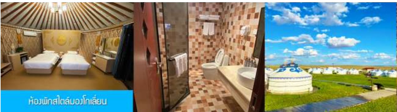
ห้องพักสไตล์มองโกลเยี่ยม