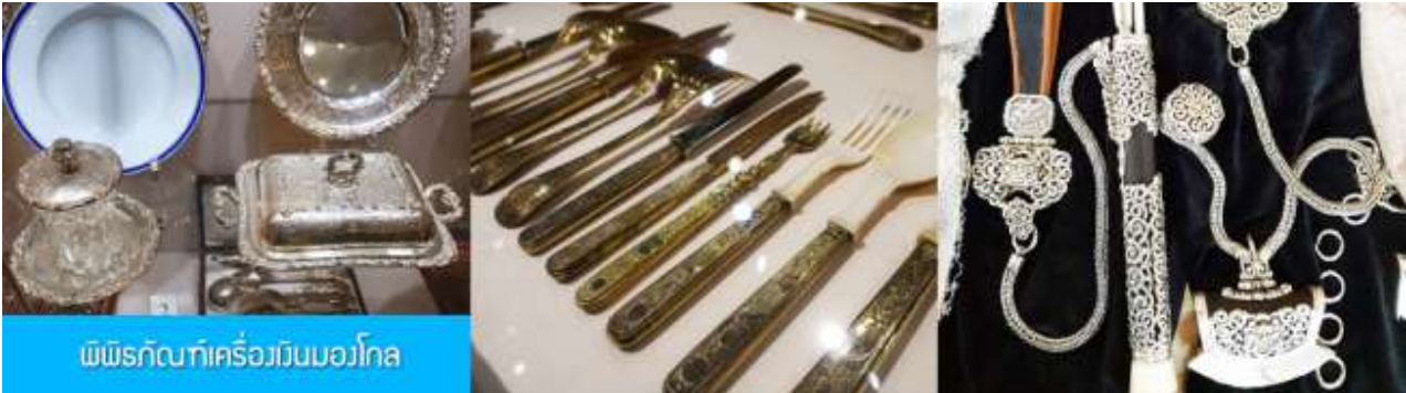
พิพิธภัณฑ์เครื่องเงินมองโกล

เช้า รับประทานอาหารเช้า ณ ห้องอาหารของโรงแรม (10)