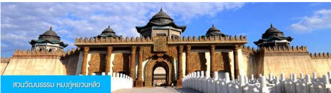
สวนวัฒนธรรม หรงกู่หยวนหลิว

หลังอาหารนำท่านเดินทางกลับเมืองเออร์ดอส (ระยะทาง 144 กม. ใช้เวลาเดินทางราว 2 ชั่วโมงเศษ)