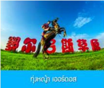
ทุ่งหญ้า เอร์โดส