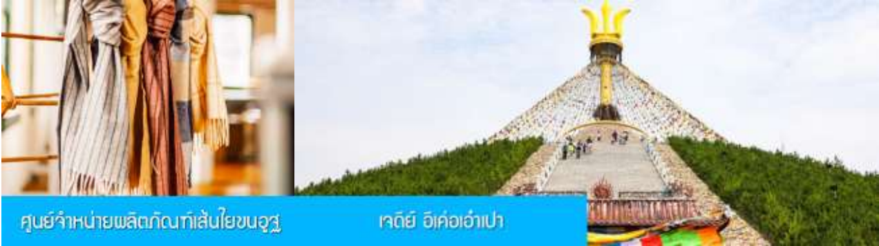
ศูนย์จำหน่ายผลิตภัณฑ์เส้นใยขนอูฐ

หลังอาหารเช้าท่านเดินทางสู่เมืองเออร์ดอส (ระยะทาง 104 กม. ใช้เวลาเดินทางราว 2 ชั่วโมง)