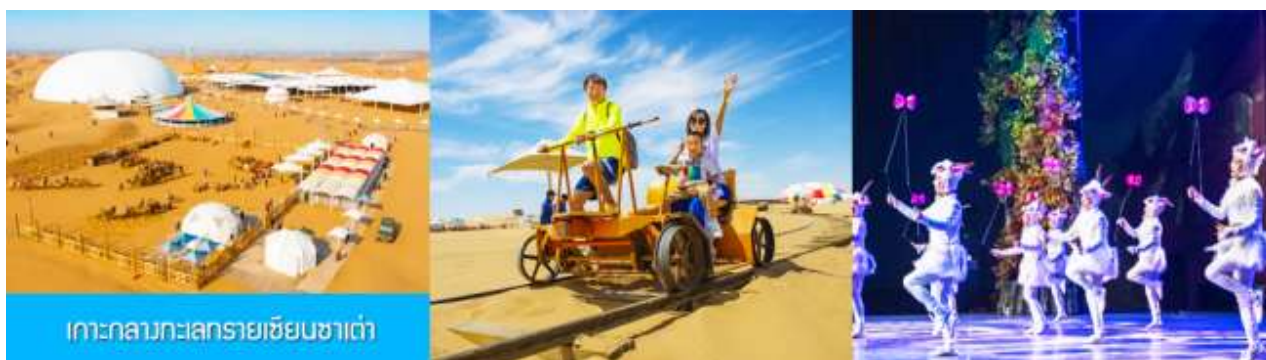
เกาะกลางทะเลทรายเขียนซาเต๋า