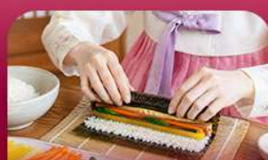
เรียงทำคิมฉับ

สัมผัสเสน่ห์ฤดูหนาวของเกาหลีแบบอบอุ่นหัวใจพิเศษ! พักสกีรีสอร์ท 1 คืน ท่ามกลางบรรยากาศหิมะขาวโพลน สนุกกับกิจกรรมฤดูหนาวยอดนิยม ทั้งสกี สโนว์บอร์ดและสโนว์สเลด ก่อนออกเดินทางสู่เกาะนามิ ดินแดนแห่งความโรแมนติก ชิมสตรอว์เบอร์รี่หวานฉ่ำ สด ๆ จากฟาร์ม พร้อมเรียนทำคิมฉับแบบฮอตฮิตสไตล์เกาหลี ปิดท้ายด้วยการช้อปปิ้งสุดฟินที่เมียงดงและชองซู ย่านอิคทีสายคาเฟ่และสายแฟชั่นห้ามพลาด