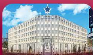
ชานซองซู