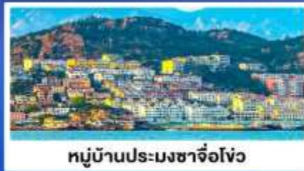
หมู่บ้านประมงซาโจ่วโจว