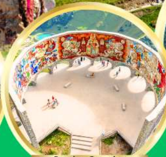
Russian-Georgian Friendship Monument