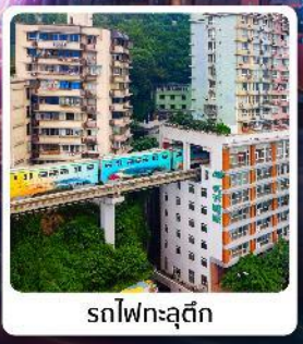
รถไฟฟ้าตุ๊กตัก

ไฮไลท์! อุทยานแห่งชาติหลุมบ่อฟ้า มรดกโลกระดับ 5A รถไฟฟ้าตุ๊กตัก ตึกตะเกียบ อลังการการแสดงหงฮยาตัง