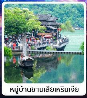
หมู่บ้านชาวน้ำเสี่ยเหรินเจีย