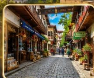
เดินเล่นย่านเมืองเก่าบรรยากาศย้อนยุค