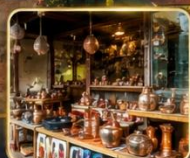
เลือกซื้อของฝากงานหัตถกรรมพื้นเมือง

สัมผัสเสน่ห์แห่งอดีตในเมืองที่เวลาเดินช้าลง กับสถาปัตยกรรมอันงดงาม วัฒนธรรมที่ยังคงมีชีวิต และความอบอุ่นจากผู้คน