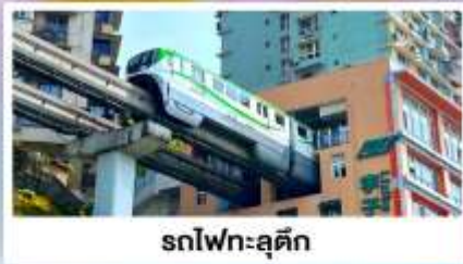
รถไฟฟ้าลัดติง