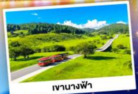
เจานางฟ้า