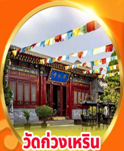
วัดกวงเหริน