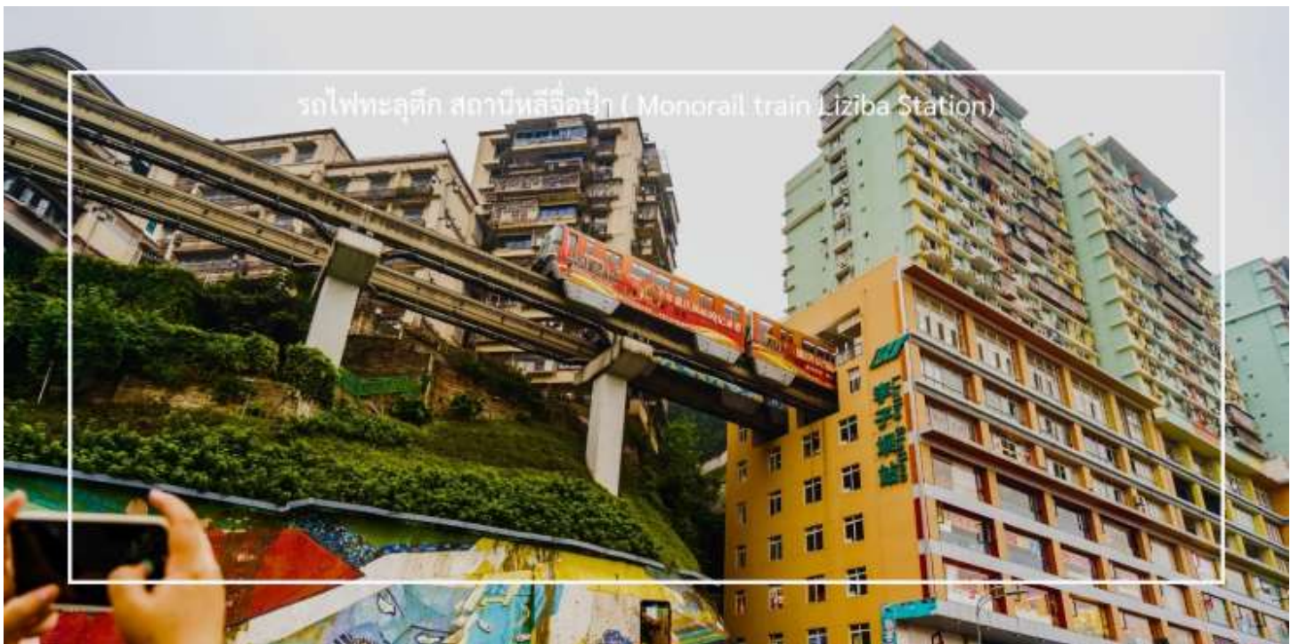
รถไฟทะลุตึก สถานีหลี่จื่อป้า ( Monorail train Liziba Station)

นำท่าน นั่งรถไฟทะลุตึก (Monorail train Liziba Station) เป็นหนึ่งในประสบการณ์ที่น่าสนใจและเป็นเอกลักษณ์ในเมืองฉงชิ่ง รถไฟเส้นนี้มีเส้นทางที่ผ่านอาคารและที่อยู่อาศัย ทำให้ผู้โดยสารรู้สึกเหมือนกำลังนั่งรถไฟที่ทะลุผ่านตึกสูง เส้นทางที่น่าสนใจในรถไฟนี้รวมถึงสถานีที่มีชื่อเสียง เช่น สถานีหลี่จื่อป้า (Liziba Station) ซึ่งตั้งอยู่ในพื้นที่ที่มีความหนาแน่นของประชากร การนั่งรถไฟทะลุตึกนี้เป็นวิธีที่ยอดเยี่ยมในการสัมผัสกับวัฒนธรรมเมืองฉงชิ่งและชื่นชมกับการพัฒนาเมืองที่น่าทึ่ง หากคุณมีโอกาสไปเยือนฉงชิ่ง อย่าลืมลองนั่งรถไฟเส้นนี้เพื่อสัมผัสประสบการณ์ที่ไม่เหมือนใคร