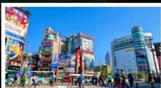
ซ้อปึงซีเหมินตึง