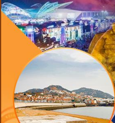
ซาจื่อโป่ว