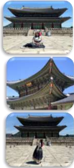
พระราชวังเคียงบก