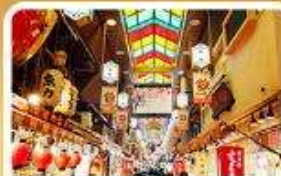
ตลาดปลาชิชิ