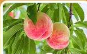
กิจกรรมเก็บผลไม้