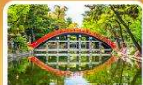
ศาลเจ้าสุมิโยชิ โทเดะ