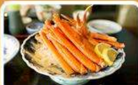
พิเศษ! ชาปู