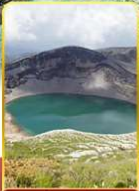
ปากปล่องภูเขาไฟซาโอ