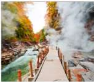
ซุนเขาโอยาสึเดียว