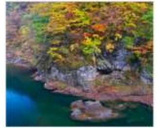
ซุนเขาดากิไคริ