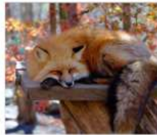
ฟาร์มสุนัขจิ้งจอก