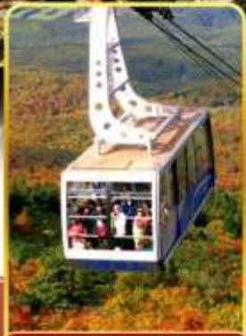
นั่งกระเช้าอิกโกดะ