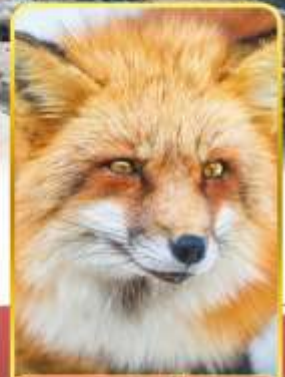
ฟาร์มสุนัขจิ้งจอก