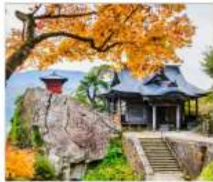
วัดยามาเดระ