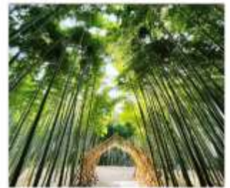
ป่าไผ่วากายามะ