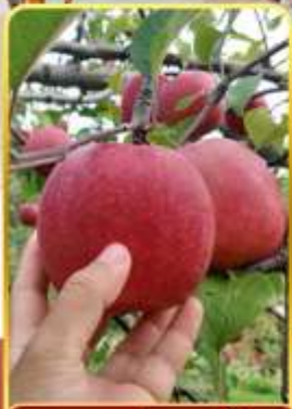
กิจกรรมเก็บแอปเปิ้ล