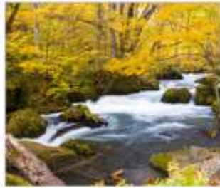
เดินเล่นลำธารโออิราเสะ