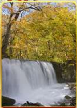
ลำธารโออิราสะ