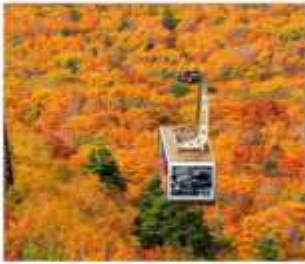
นั่งกระเช้าซึกโกดะ