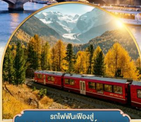
รถไฟฟันเฟืองสู่ยอดเขากรอนเนอ์เกรต