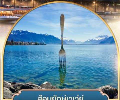
ส้อมยักเขาวัว