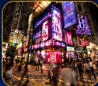
ซอปปิงซินชาฮุย