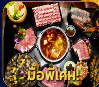
บุฟเฟ่ต์ชาบูสโตร์ฮ่องกง