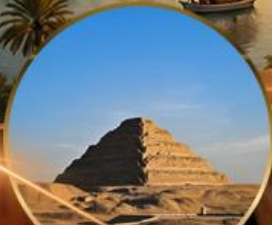
พีระมิดขั้นบันได