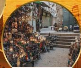
ตลาดบ้านเอลคาลิสิ