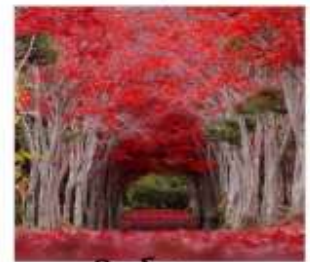
ชิราโอะกะ (จูนงค้ไบนเมเน็ล)