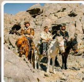
ชนเผ่ามองโกเลีย