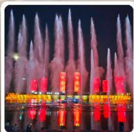
น้ำพุคังปาสือ