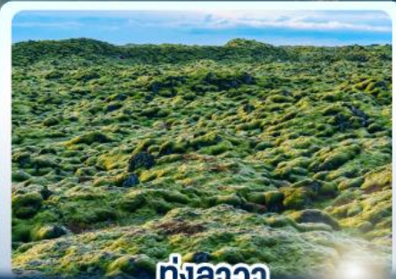
ทุ่งลาวา