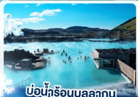
แช่น้ำร้อนบลูลากูน

เก็บไอซ์แลนด์ แดนภูเขาไฟคิรูกูฟลา และ แช่น้ำร้อนบลูลากูน