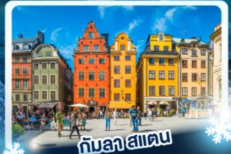
กับลาสแตน