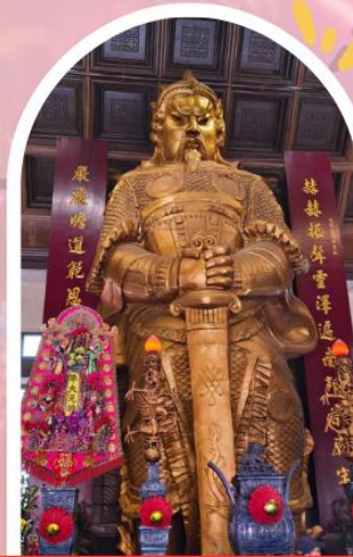
วัดเซกวง ขอพรโชคลาภ การเงิน และธุรกิจ