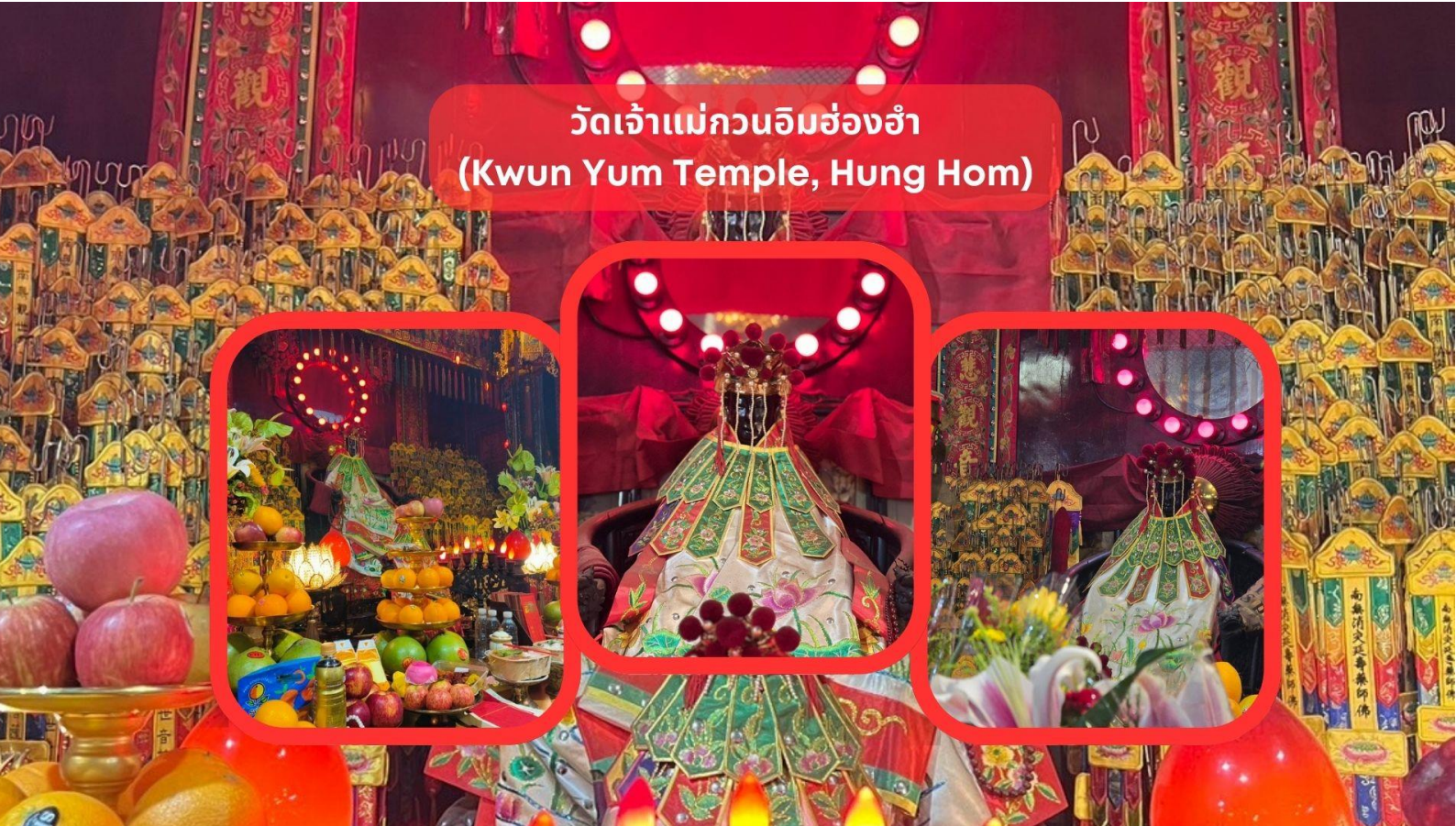
วัดเจ้าแม่กวนอิมฮ่องกง (Kwun Yum Temple, Hung Hom)

รับประทานอาหารเช้า ณ ภัตตาคาร บริการท่านด้วยเมนูติ่มซำฮ่องกง (มื้อที่ 3)