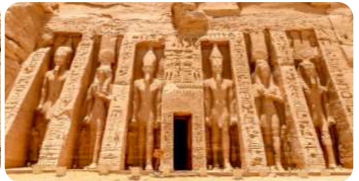
สมควรแก่เวลานำท่านเดินทางกลับเมืองอัสวาน