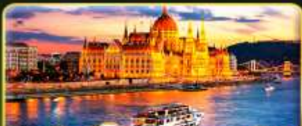
ส่องเรือแม่น้ำดานูบ ช่วง Twilight พร้อมจินตนาการ

📅 เดินทาง: 02-09 ธ.ค. | 06-13 ธ.ค. 10-16 ธ.ค. 69