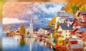
การันตีที่พัก Hallstatt/ St.Wolfgang หรือริบทะเลสาบ 1 คืน