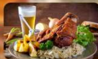
พิเศษ! ลิ้มลองเมนูประจำชาติ ทั้ง 5 ประเทศ!!!