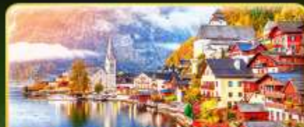
การันตีพัก Hallstatt / St. Wolfgang หรือริมนทะเลสาบ 1 คืน