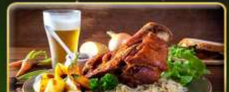
พิเศษ! ลิ้มลองเมนูประจำชาติ ถึง 5 ประเทศ!!!