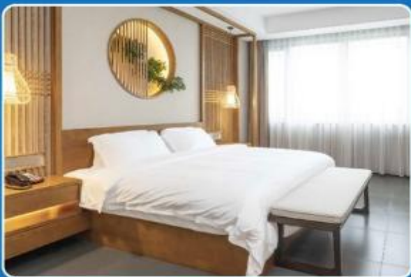
2 PERSON DOUBLE (DBL)