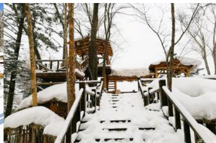
ระเบียงชมวิวยูยชาน

วันที่สาม เมืองฮาร์บิน-สถานีรถไฟยาบูลี-รวมนั่งม้าลากเลื่อน- หมู่บ้านหิมะ Xue xiang China Snow Town - ระเบียงชมวิวยูยชาน- ชมแสงสียามราตรีหมู่บ้านหิมะ-ชมพลุไฟและขบวนพาเหรดระบำพื้นเมือง-นอนในหมู่บ้านหิมะ Xue xiang