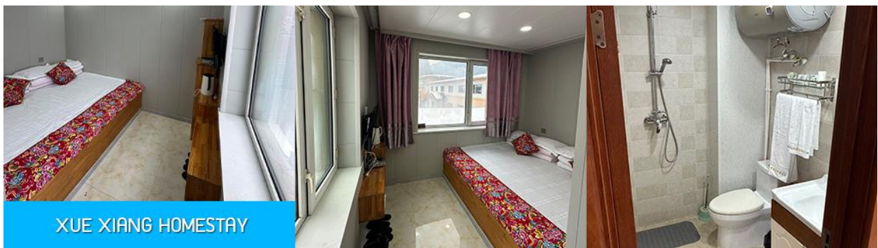
XUE XIANG HOMESTAY