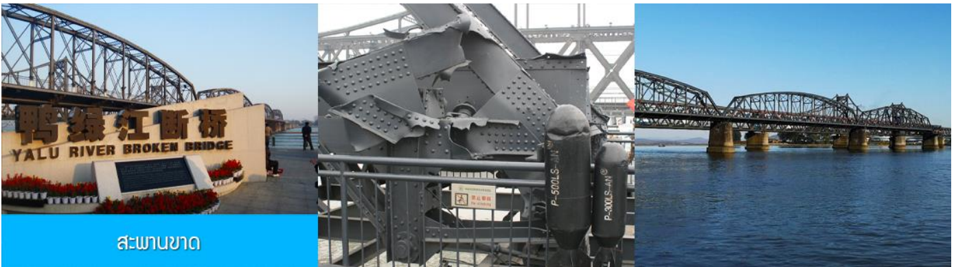
สะพานขาด