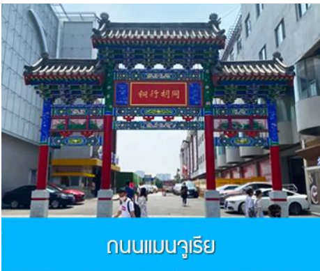
ถนนแมนจูเรีย