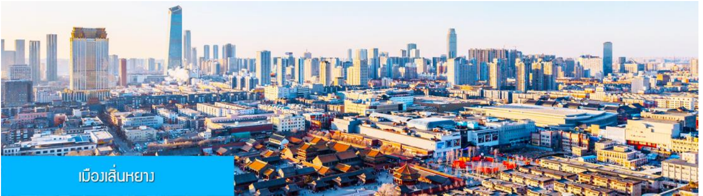
เมืองเสิ่นหยาง