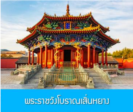
พระราชวังโบราณเสียนหยาง

รับประทานอาหารเช้า ณ ห้องอาหารของโรงแรม (1)