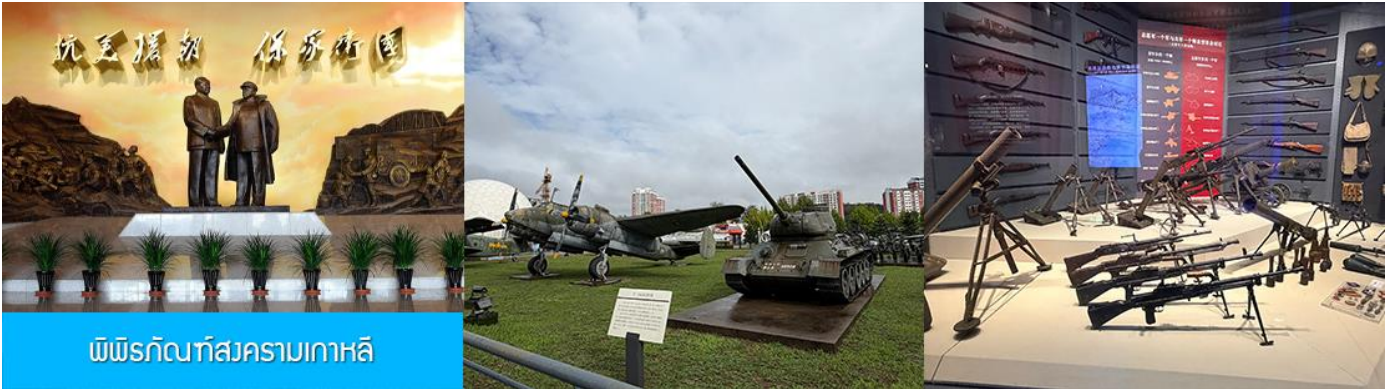
พิพิธภัณฑ์สงครามเกาหลี