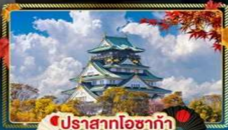
🍎 ปราสาทโอซาก้า