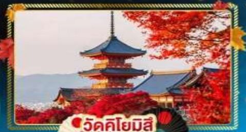
🍎 วัดคิโยมิสึ