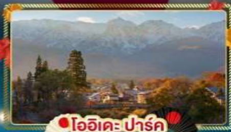
🍎 โออิชิ ปาร์ค