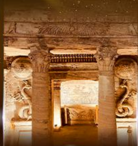
สุสานใต้ดินอเล็กซานเดรีย