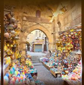
ตลาดงานเวลาสี่