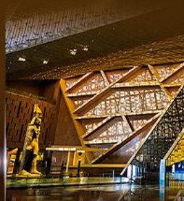
พิพิธภัณฑ์ไทรนิตี้อียิปต์ (GEM)