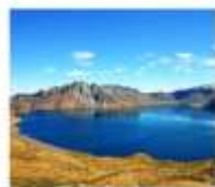
ฉางไป่ซาน