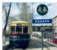
มังกรธาฉางชุน