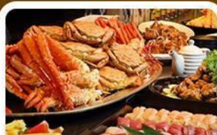
บุฟเฟ่ต์ชาบู+ชาปู 3 ชนิด