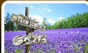
โทมิตะฟาร์ม