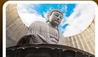
เนินเขาแห่งพระพุทธรเจ้า