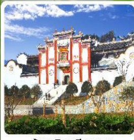
บ้านเกิดชวีหยวน