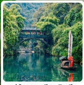
หมู่บ้านซานเสี่ยเหรินเจีย