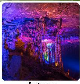
ดำเก้าทพ