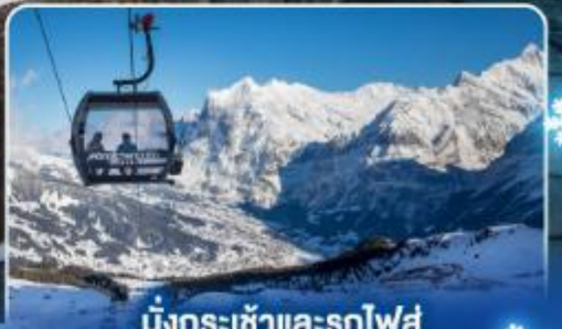
นั่งกระเช้าและรถไฟสุด อลเวงจากเจนีวา