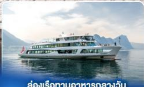
ล่องเรือทานอาหารกลางวัน ทะเลสาบลูเชิร์น