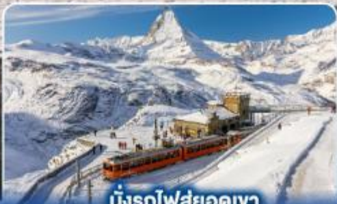
นั่งรถไฟสุดอลเวง กรอนเนอร์เกรต