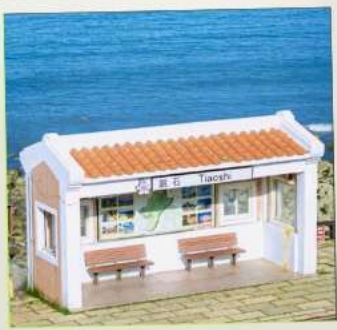
Tiaoshi Bus Station