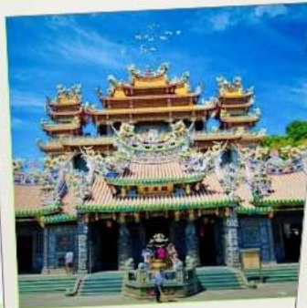
วัดกวนตู่