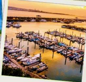
ท่าเรือประมงตั้นส่วย