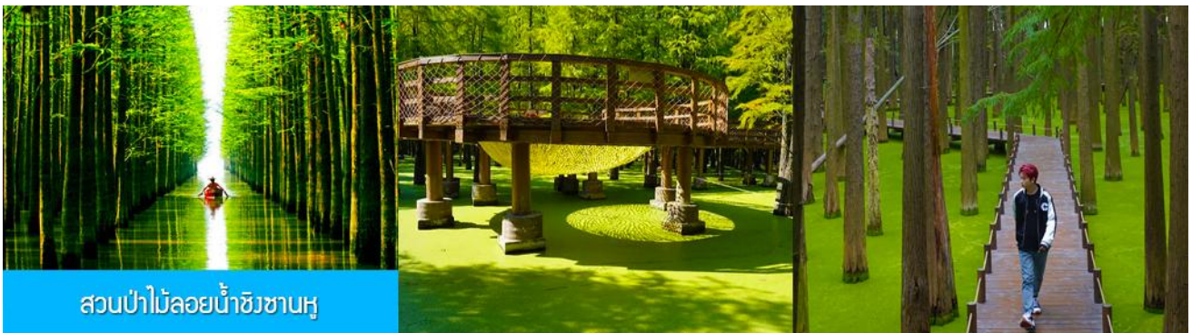
สวนป่าไม้ลอยน้ำชิงซานหู

หลังอาหารเช้าท่านเดินทางโดยรถบัสสู่เมืองหลิงอัน 临安市 (ระยะทาง 175 กม. ใช้เวลาเดินทางราว 2 ชั่วโมงเศษ)