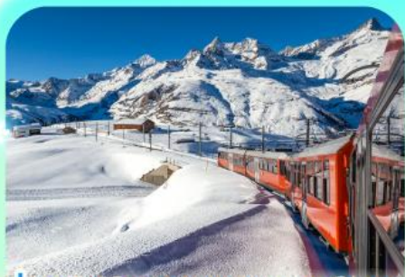
นั่งรถไฟสู่ยอดเขารอนเนอร์เกรด