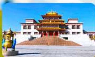
คฤหาสน์พุทธบูชาแห่งชีวิคยูลาน