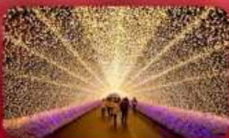
นาบานาโนะซาโตะ