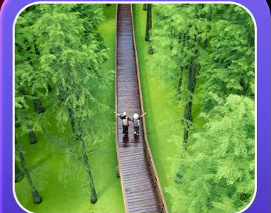
“ป่าสนชิงซาน”