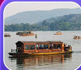
“ล่องเรือทะเลสาบซีหู”