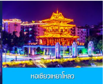
หอชิวเหยาไหล