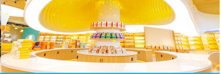
พิพิธภัณฑ์ดอกกุยฮวา

จากนั้นนำท่านเที่ยวชม พิพิธภัณฑ์ดอกกุยฮวา 桂花公社 ดอกกุยฮวาเป็นดอกไม้สีเหลืองที่มีกลิ่นหอม เป็นดอกไม้ประจำเมืองของกุยหลิน จะเบ่งบานในช่วงเดือนมิถุนายน – กรกฎาคมของทุกปี ในช่วงที่ดอกกุยฮวาเบ่งบานในเมืองกุยหลินจะคลุ้งไปด้วยกลิ่นหอมจากดอกกุยฮวา ทั่วเมืองกุยหลินจะเต็มไปด้วยสีเหลืองของดอกกุยฮวา ดอกกุยฮวาสามารถนำมาแปรรูปเป็นอาหารและเครื่องดื่มได้ และได้รับความนิยมจากชาวจีนตอนใต้เป็นอย่างมาก ชมพิพิธภัณฑ์ที่ทันสมัยด้วยระบบจัดแสดงที่ทันสมัย ภายในพิพิธภัณฑ์มีความโอ้อ่า มีการสาธิตและจำหน่ายผลิตภัณฑ์ที่ทำจากดอกกุยฮวา อาทิ ขนมดอกกุยฮวา ชาที่ทำจากดอกกุยฮวา และสินค้าพื้นเมืองอื่น ๆ