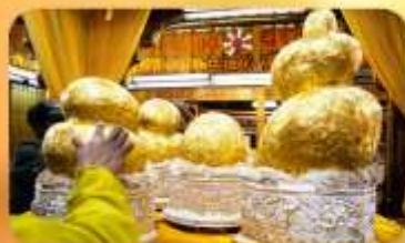
พระบิวเข้ม