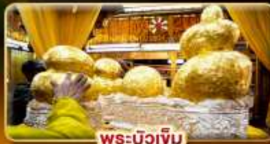
พระบิวเจิม