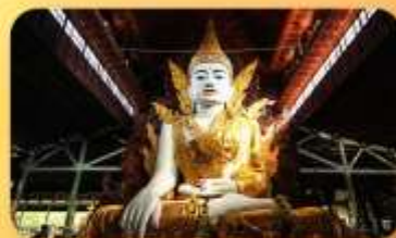
วัดหงากัดจี