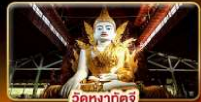
วัดหงาทัตจี